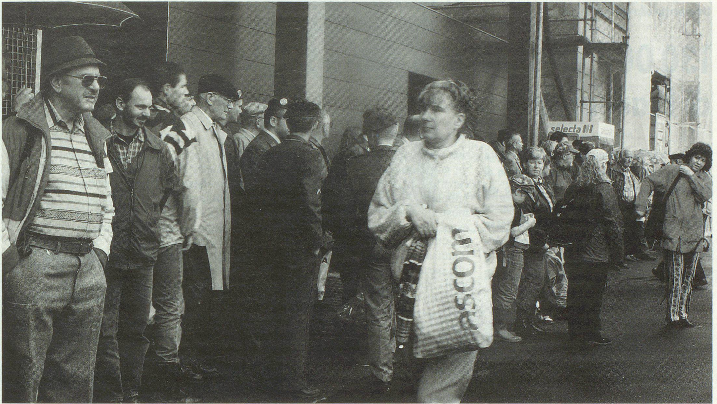
130 000 visiteuses et visiteurs à la journée de l'armée 1998 et presque tous étaient enchantés.

spectre qu'offre l'armée suisse. Les points d'attraction principaux furent les démonstrations de la brigade de chars, celles des moyens de transports aériens et celles de l'aviation. Dans onze arènes, on montrait les domaines d'intervention des armes les plus diverses et les expositions ont traité dans le détail de 14 sujets. Enfin, un programme annexe avec des films et des jeux militaires dans toutes les cantines, apportèrent avec d'autres attractions, beaucoup de variété.