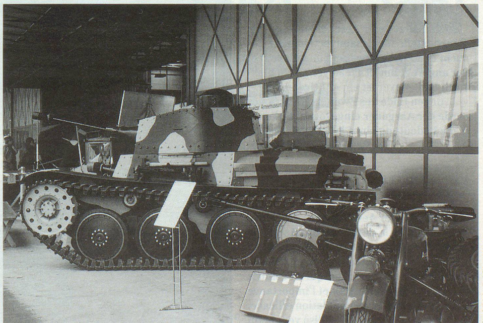
L'armée suisse d'il y a 50 ans: un char Praga 39 du Musée suisse de l'armée.