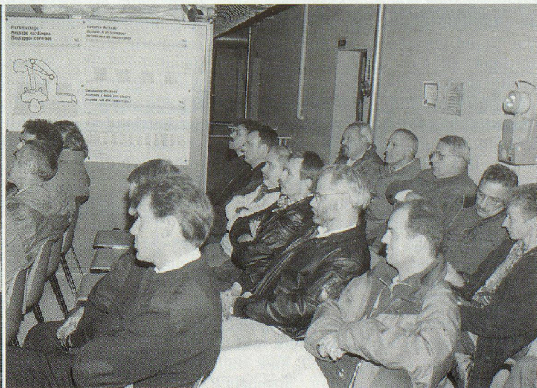
Eine grosse Schar interessierter Besucher liess sich über das Konzept der ZSO Stein am Rhein informieren.