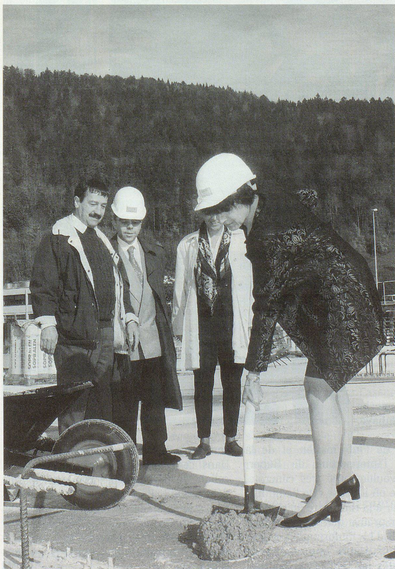
La première pierre est scellée.