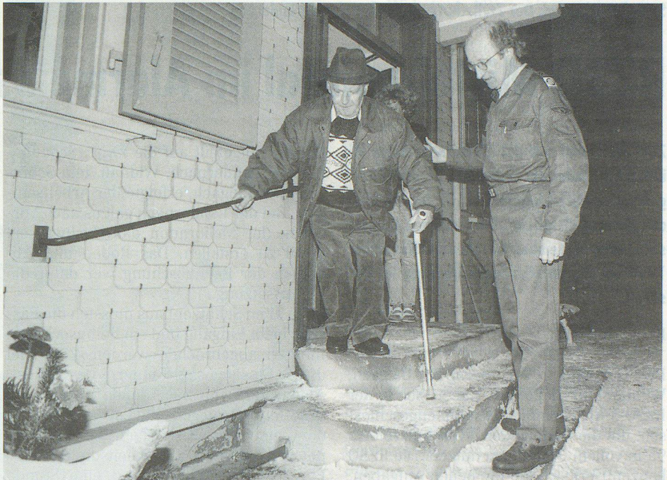
Zivilschützer zeigten bei der Dislokation der Betagten grosse Hilfsbereitschaft.

Die Totalsanierung des Altersheimes Riedernholz, dem einzigen von der Stadt St.Gallen betriebenen Altersheim mit 19 Pensionärinnen und Pensionären, wurde vom Grossen Gemeinderat der Stadt im Mai 1996 beschlossen. Die Bruttoinvestitionen betragen 4,487 Mio. Franken. Davon hat die Stadt 3,410 Mio. zu tragen. Die Qualität der Bausubstanz des rund 150 Jahre alten Gebäudes ist gut. Es müssen jedoch die sanitären Einrichtungen, das Dach, die Fenster und die Infrastruktur für ein Altersheim den heutigen Bedürfnissen angepasst werden. So fehlen beispiels-