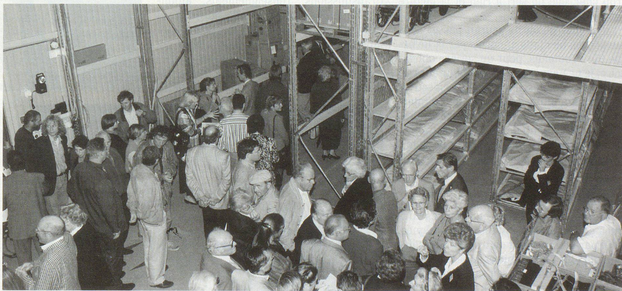
Une petite partie de l'abri consacré aux biens culturels.