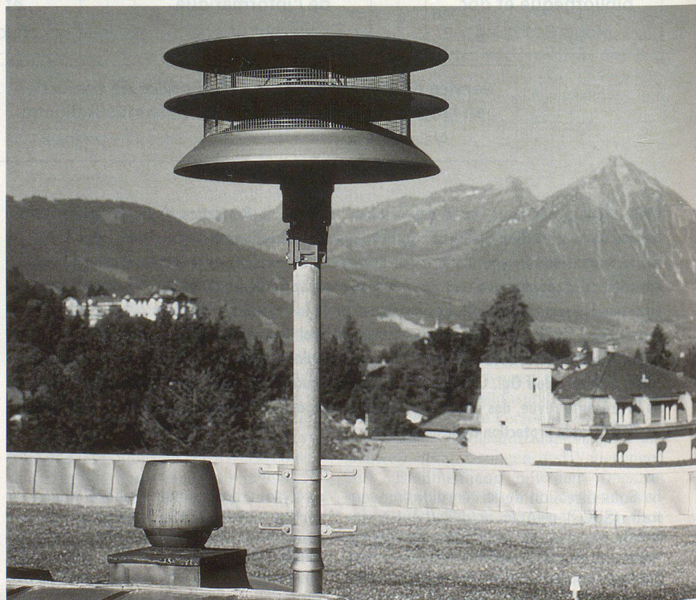
La section de l'information suit et commente la réalisation de l'essai d'alarme annuel sur tout le territoire suisse.

La section dispose également d'un service cinématographique qui produit et prête des films et des cassettes vidéo. Mentionnons également la constitution de volumineuses archives photographiques, la