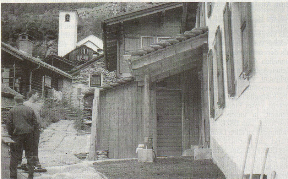
Der Anbau an das Schulhaus von Landarenca.