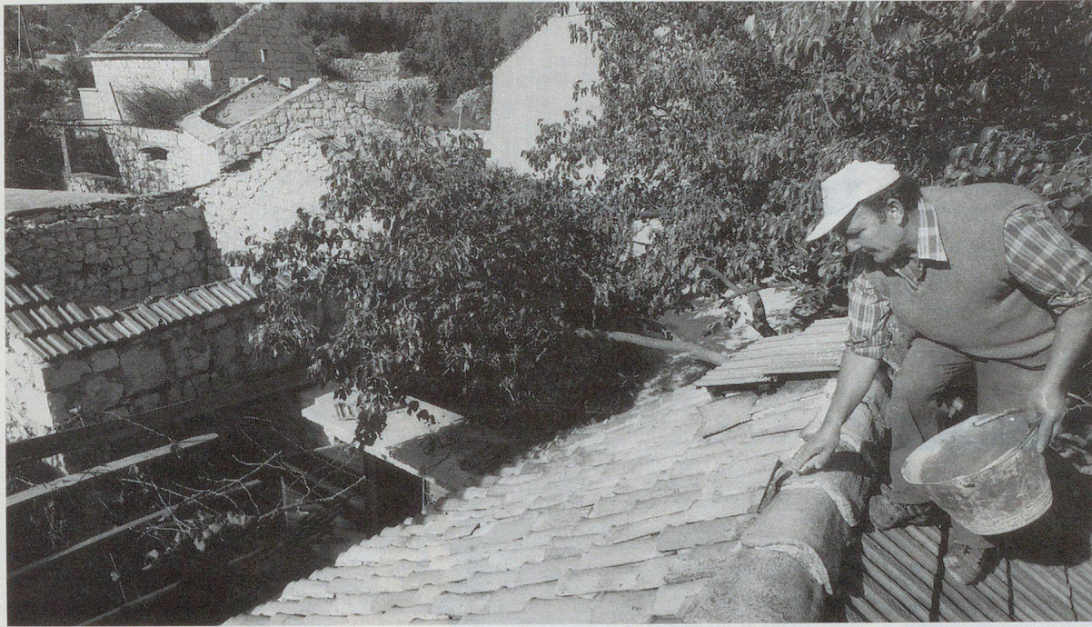
Wiederaufbau in Ex-Jugoslawien. Unter der Leitung des SKH werden Infrastrukturen und auch ganze Dörfer im Rohbau wieder aufgebaut.