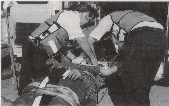
Le groupe de sauvetage de l'armée vient à la rescousse...