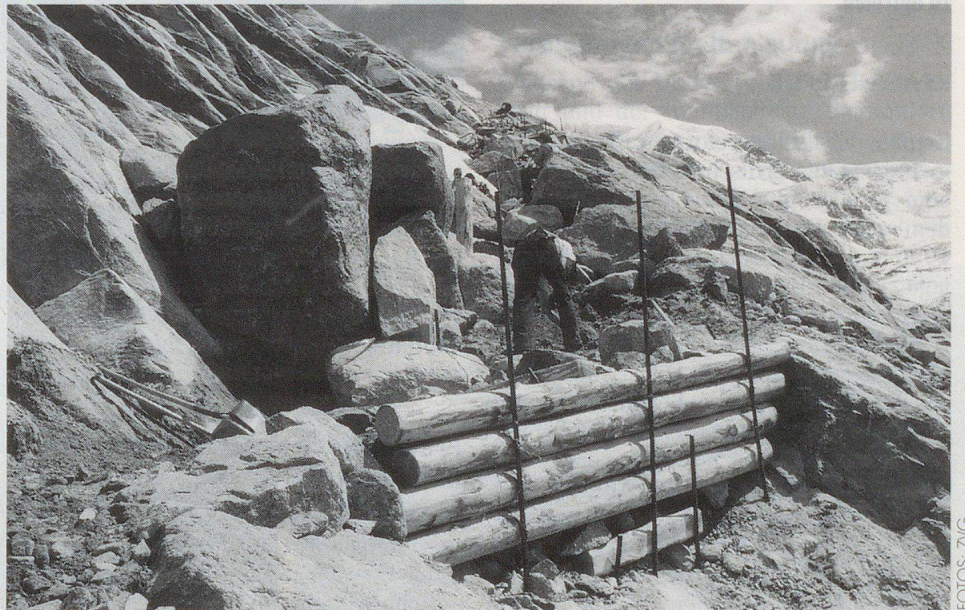
Der Weg wird mit massiven Rundhölzern gesichert.