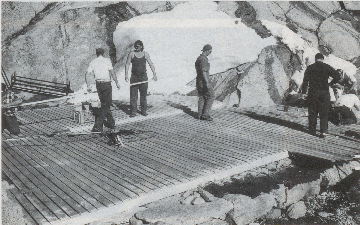
Eine Holzplattform zur Freude der Sonnenhungrigen.