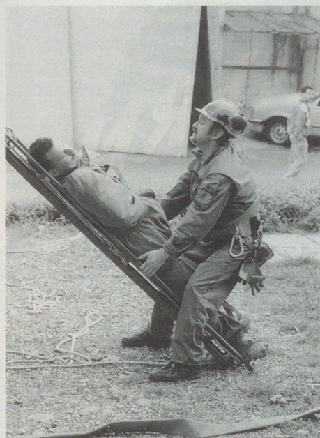
Zivilschutz im Rettungseinsatz.