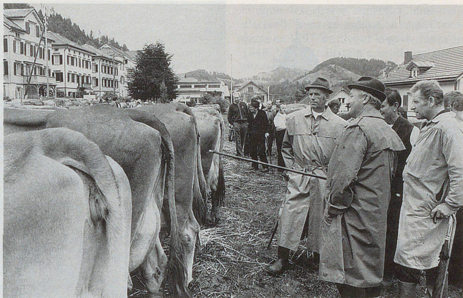
Die Viehschau in Urnäsch zeugt von einem gesunden Bauernstand.

Um manche Heiler ranken sich geradezu wundersame Geschichten. Eine Erzählung, die allerdings schon rund 50 Jahre zurückliegt, möge dies aufzeigen: In Teufen lebte ein Doktor Schnider, der angeblich wahre Wunder wirkte. Er behandelte alle Leute, ob arm oder reich. Wenn ein Patient ihm klagte, er habe kein Geld, verzichtete er grosszügig auf das Honorar. Aber wehe, wenn der Patient ihn angelogen hatte. Wollte er in Teufen wieder die Bahn besteigen, blieb er wie angewurzelt stehen und konnte keinen Schritt mehr vorwärts tun. Die Bahnbediensteten wussten Bescheid und schickten ihn zu Doktor Schnider zurück, um die Rechnung zu bezahlen. Ob die Geschichte wahr ist, lässt