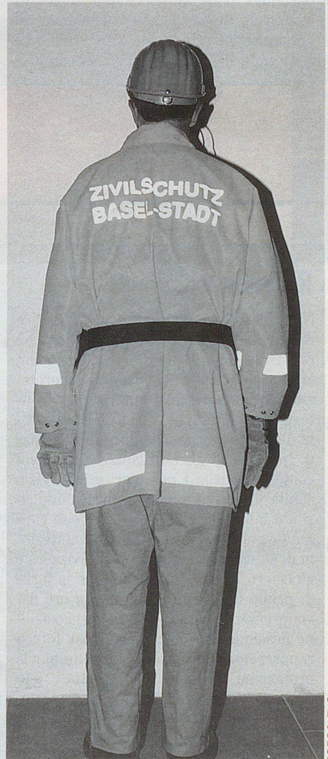
Orangefarbene persönliche Ausrüstung (vorne und hinten).