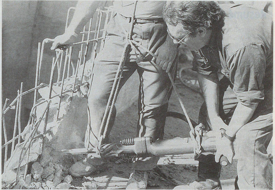
Ein unkonventioneller aber praxisgerechter Bohrhammereinsatz.

Erst in den Wiederholungskursen werden spezielle Schulungen resp. Trainings angeboten und durchgeführt. So sind zum Beispiel alle Angehörigen der Sanitätsformationen sowie die Kader der Rettungsdetachements in der Herz-Lungen-Reanimation (CPR) ausgebildet und geprüft. Die Angehörigen der Bevölkerungsschutzdetachements leisten Dienst in Alters- und Pflegeheimen, in Alzheimerlagern und beim Behindertentransport TIXI. Die mobilen Rettungsdetachements absolvieren in unwegsamen Berggebieten, unter erschwerten Bedingungen, ihren Dienst. ▣