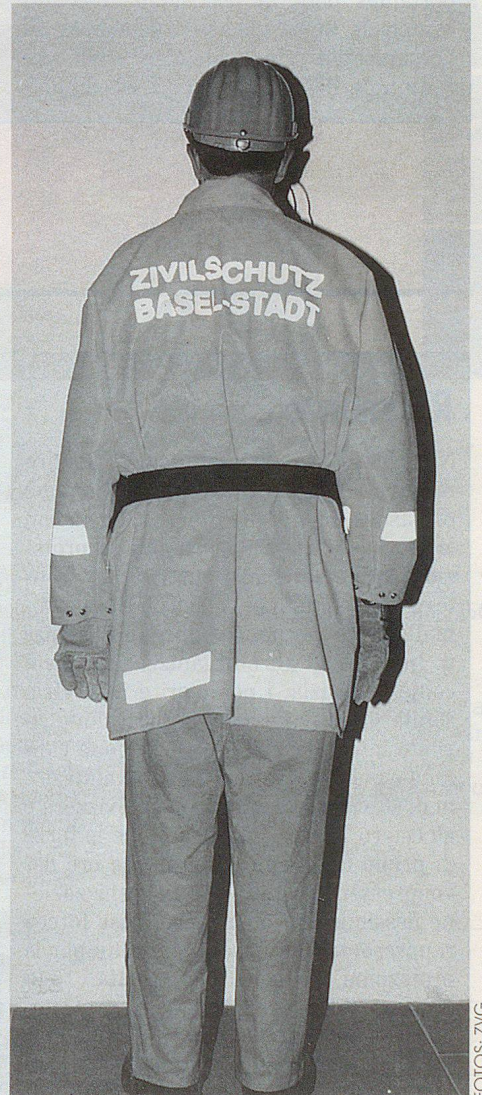
Orangefarbene persönliche Ausrüstung (vorne und hinten).