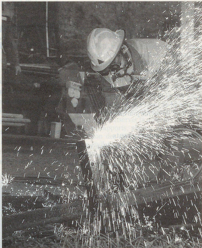
On s'exerce au chalumeau découpeur.