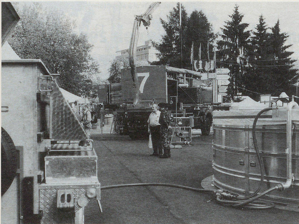
A destra la vasca da 50 m 3 del Welab 8 (protezione dell'ambiente) nella quale viene raccolta acqua sporca – ad esempio in caso di incidenti con fuoriuscita di olio – e quindi depurata.

senz'altro impressionante e convincente. Nello sviluppo del materiale per i bat acc, è stato svolto un grande lavoro approfondito di pianificazione, come ha confermato un giro attraverso tutta l'esposizione, durante il quale alcuni membri dell'esercito hanno fornito spiegazioni competenti e hanno illustrato tutto ciò che era degno di nota in modo chiaro e conciso su appositi tabelloni.