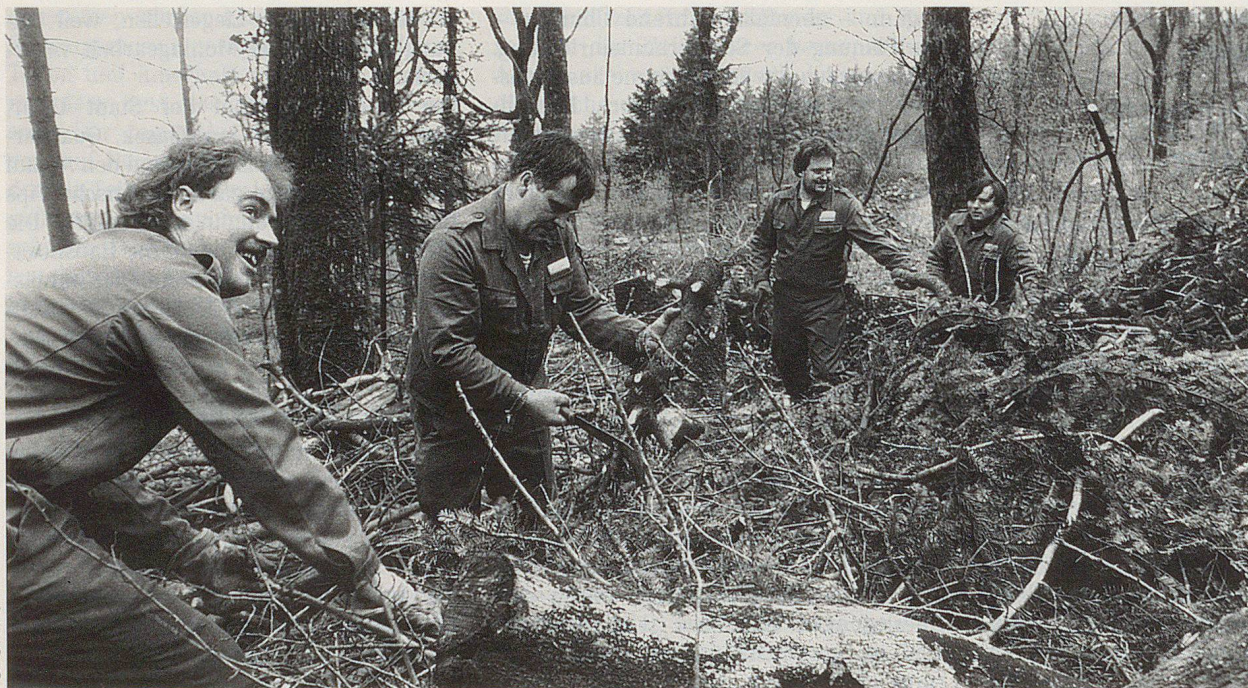
Die ZSO Biel bei ihrem interessanten Arbeitseinsatz.