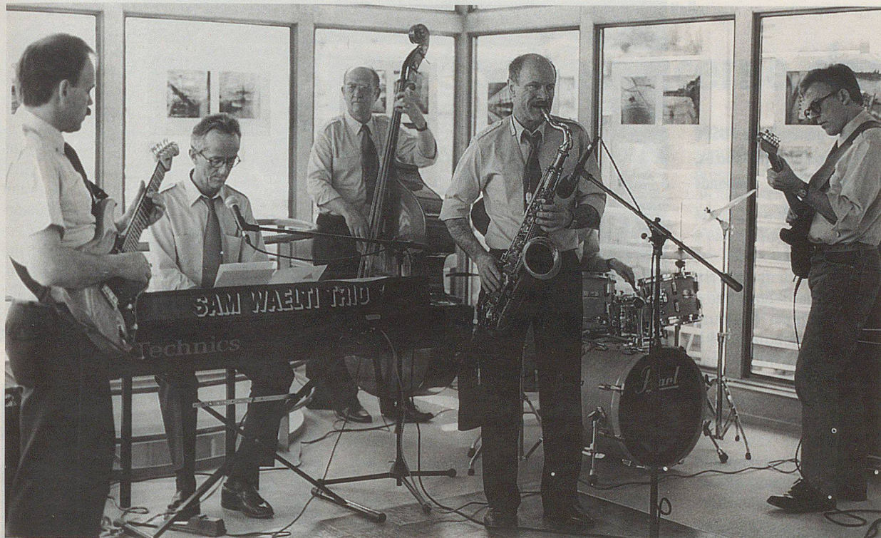
Musikalischer Auftakt zur Schifffahrt auf dem Rhein mit der Zivilschutz-Band Basel.