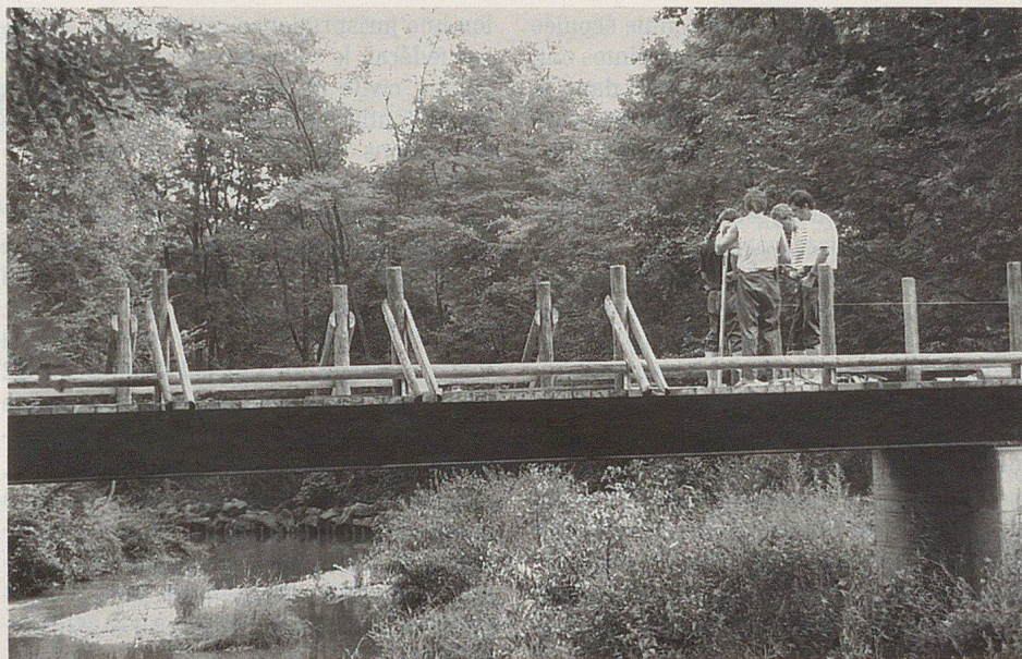
La Venoge avec sa zone alluviale.