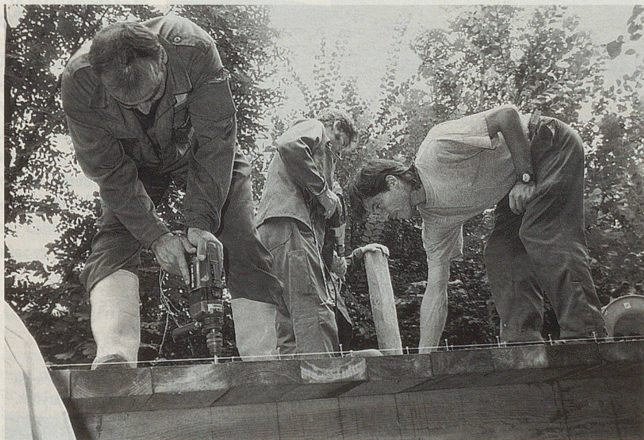
3500 vis, on apprécie l'électricité.