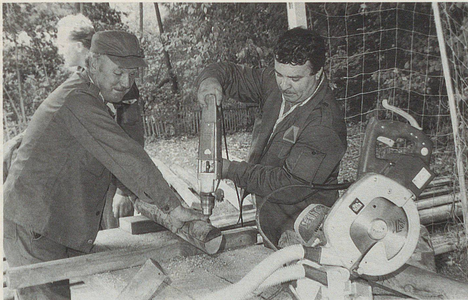
Tout le bois a été façonné dans une scierie improvisée.