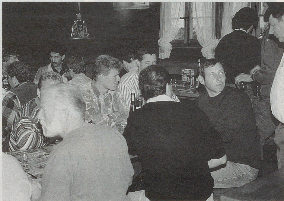
Nach einem langen Arbeitstag folgte am Abend der gemütliche Teil.

Das Gemeindeterritorium von Ausserberg liegt auf der rechten Rhonetalseite zwischen dem Baltschiederbach und dem Bietschtal. Auf dieser stark abschüssigen südlichen Abdachung, die sich von der Rhone bis zur Spitze des Wiwannahorns ausdehnt, befindet sich das Siedlungs- und Wirtschaftsgebiet der Gemeinde. Ausserberg hat rund 700 Einwohner. Wie alle Dörfer in der Region ist auch Ausserberg stark von der schlechten wirtschaftlichen Lage des Oberwallis betroffen. «Die jungen Leute müssen leider immer häufiger auswandern, da in der Region einfach nicht genügend Arbeitsstellen vorhanden sind»,