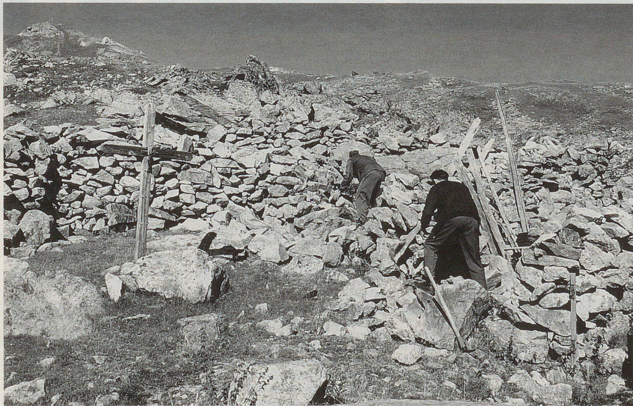
Auf 2300 Meter Höhe wurde emsig am Projekt «Färicha» gearbeitet.

untergebracht. Auf einem Hochplateau, im Gebiet «Färicha» genannt, unterhalb der Wiwannahütte, befindet sich auf 2300 Meter über Meer ein Schafpferch aus Trockensteinmauern. Die Funktion dieses Schafpferchs ist die Schafscheide. Die Alp-herde wird im Sommer und im Herbst mehrmals in diesem Pferch zusammengetrieben, um sie zu scheiden. Mittelgang und Seitengehege des Pferchs dienen dazu, die Tiere aus der grossen Schaf-