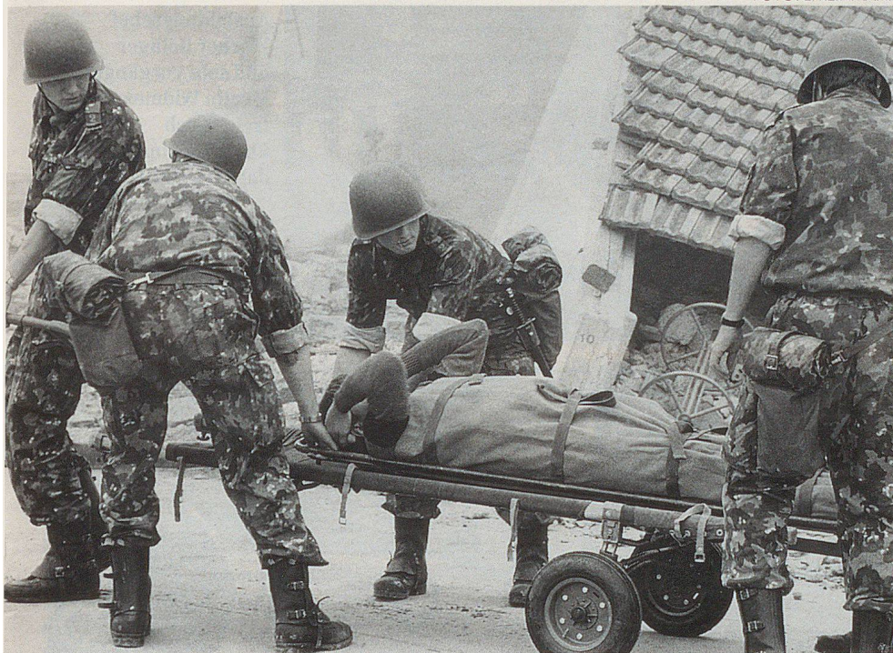
Le truppe di salvataggio sono addestrate ed equipaggiate per prestare soccorso in condizioni difficili.

ziale in caso di eventi gravi e molto estesi. Insieme agli strumenti civili si determina generalmente il seguente ordine di priorità degli interventi: