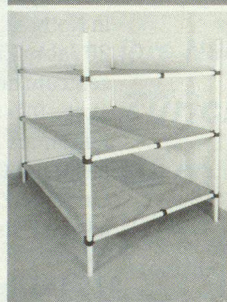
Dreier- und Sechserliegen

Kellergestell in Friedenszeiten. Bequeme Liegestelle im Katastrophenfall, dank integrierter Tuchliegefläche ist KEINE MATRATZE notwendig.