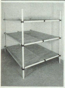
Dreier- und Sechserliegen

Kellergestell in Friedenszeiten. Bequeme Liegestelle im Katastrophenfall, dank integrierter Tuchliegende ist KEINE MATRATZE notwendig.