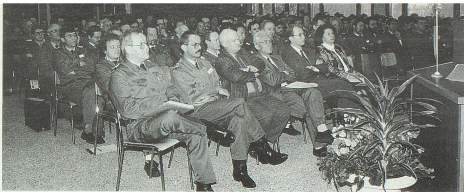
Plus de 180 cadres supérieurs de l'OPC ont participé à cette journée d'information.