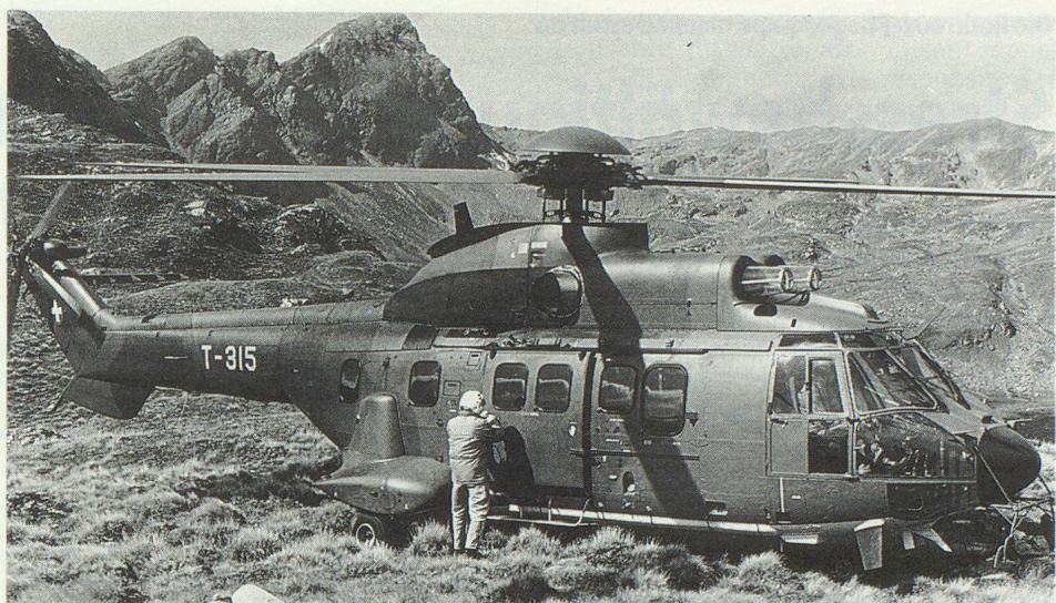
Auf dem Grener Berg gelangte der «Super Puma» der Armee zum Einsatz.

Neben dem Pionier- und Brandschutz-Dienst leistete der Versorgungs-Dienst (Küche) unter der Leitung von André Notter einen Grosseinsatz, war die Küchenmannschaft doch täglich von fünf Uhr morgens bis zehn Uhr abends im Einsatz. In der bestehenden Küche konnte jeweils nur das Essen für 50 Personen zubereitet werden, und so musste für die rund 120 Mann und fünf