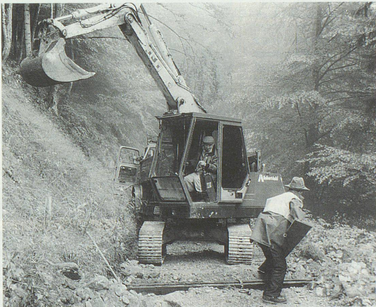
Auch Baumaschinen gelangen zum Einsatz.