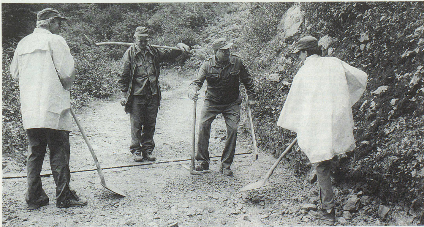
Strassensanierung mit Schaufel und Pickel.