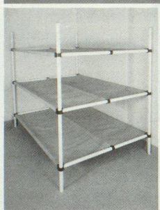
Dreier- und Sechserliegen

Kellergestell in Friedenszeiten. Bequeme Liegestelle im Katastrophenfall, dank integrierter Tuchliegende ist KEINE MATRATZE notwendig.