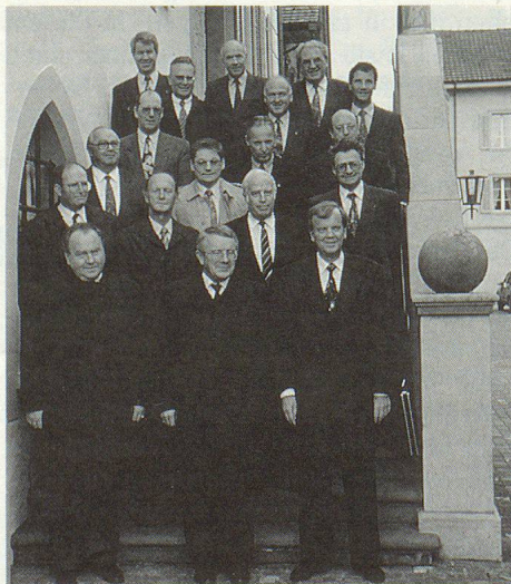
Les conseillers d'Etat chargés de la PCI devant l'Hôtel de Ville à Sarnen.

La sécurité intérieure du pays comprend l'ensemble des mesures propres à assurer l'ordre et la protection de l'Etat. Elle n'implique pas seulement la lutte contre la criminalité, mais également l'aide en cas de catastrophes d'origine naturelle ou techni-