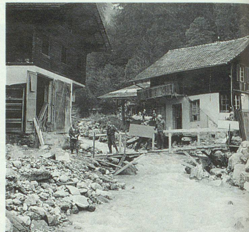
Detachment 1: Die Zivilschützer stossen auf ein Chaos.

etliche 10000 Franken einsparen. Und die Bevölkerung profitierte von Brennholz, das ihnen die Ostermundiger in gebrauchsfertiger Form bereitstellten. ▀