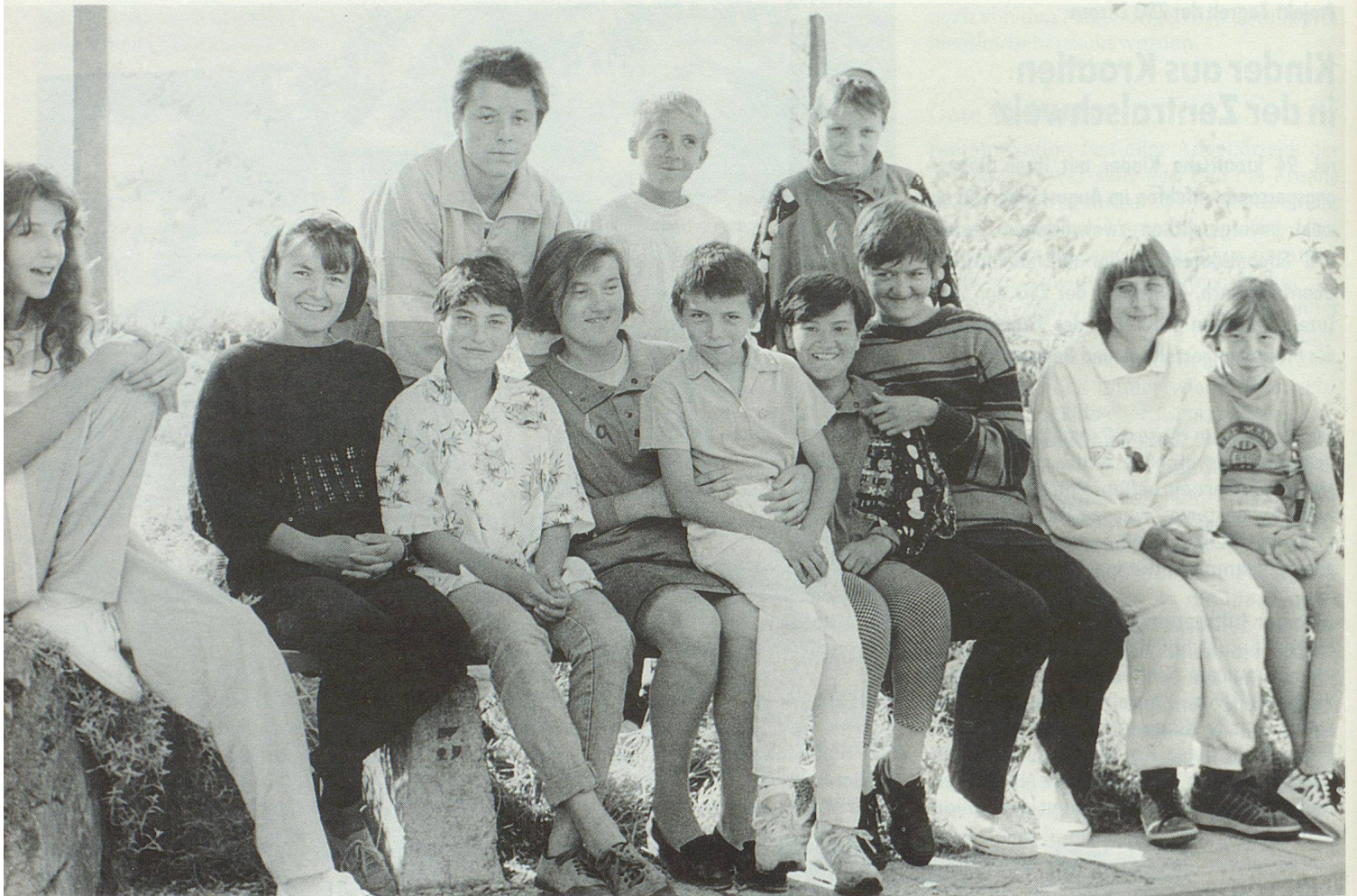
Den Fotoapparat gezückt, und schon versammelten sich einige zum Gruppenbild.

brachte auf diese Weise das Geld für die Reise zusammen und viele Privatpersonen boten ihre Hilfe an.