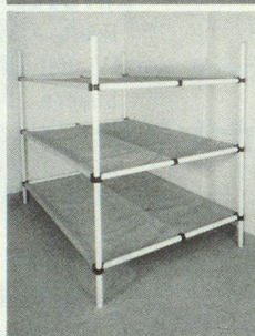
Dreier- und Sechserliegen

Kellergestell in Friedenszeiten. Bequeme Liegestelle im Katastrophenfall, dank integrierter Tuchliegefläche ist KEINE MATRATZE notwendig.