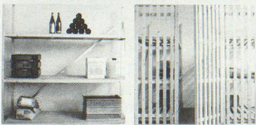
Mehrzweck-Schutzraum-Liegestellen, die Sie mit wenigen Handgriffen zu Lagergestellen, Keller- oder Estrich-Trennwänden umbauen können.