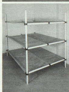
Dreier- und Sechserliegen

Kellergestell in Friedenszeiten. Bequeme Liegestelle im Katastrophenfall, dank integrierter Tuchliegefläche ist KEINE MATRATZE notwendig.