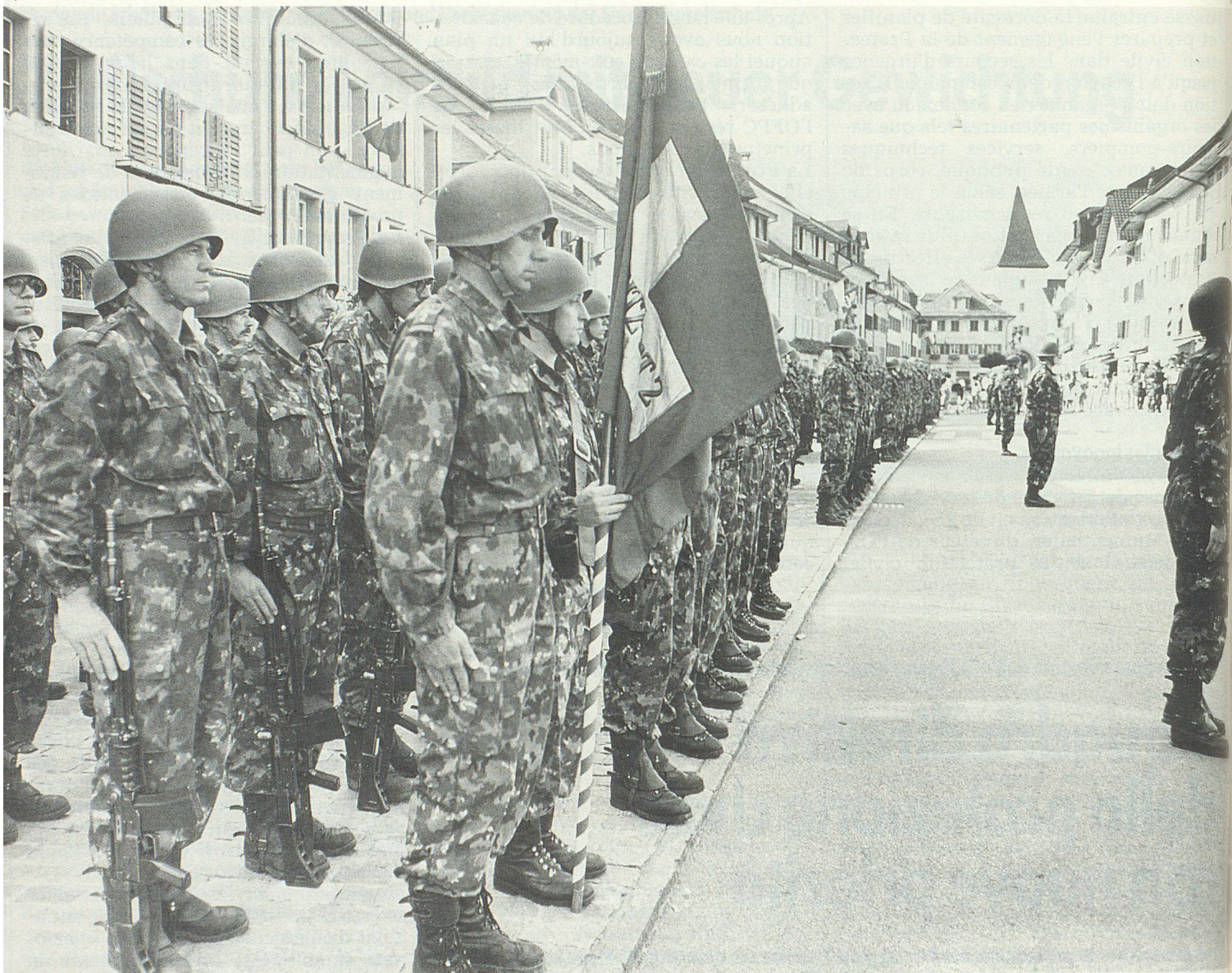
Die allgemeine Dienstpflicht bleibt aufrechterhalten. Am Milizcharakter der Armee wird festgehalten.