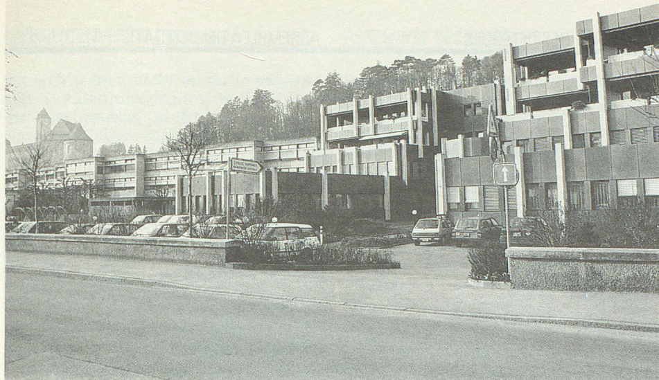
L'administration cantonale, à Porrentruy, abrite le bureau de la protection civile.