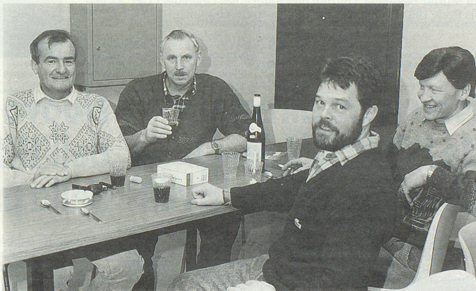
Die Küchenmannschaft bei einer wohlverdienten Pause. Dazu gehört auch ein währschafftes Entlebucher «Kafi».