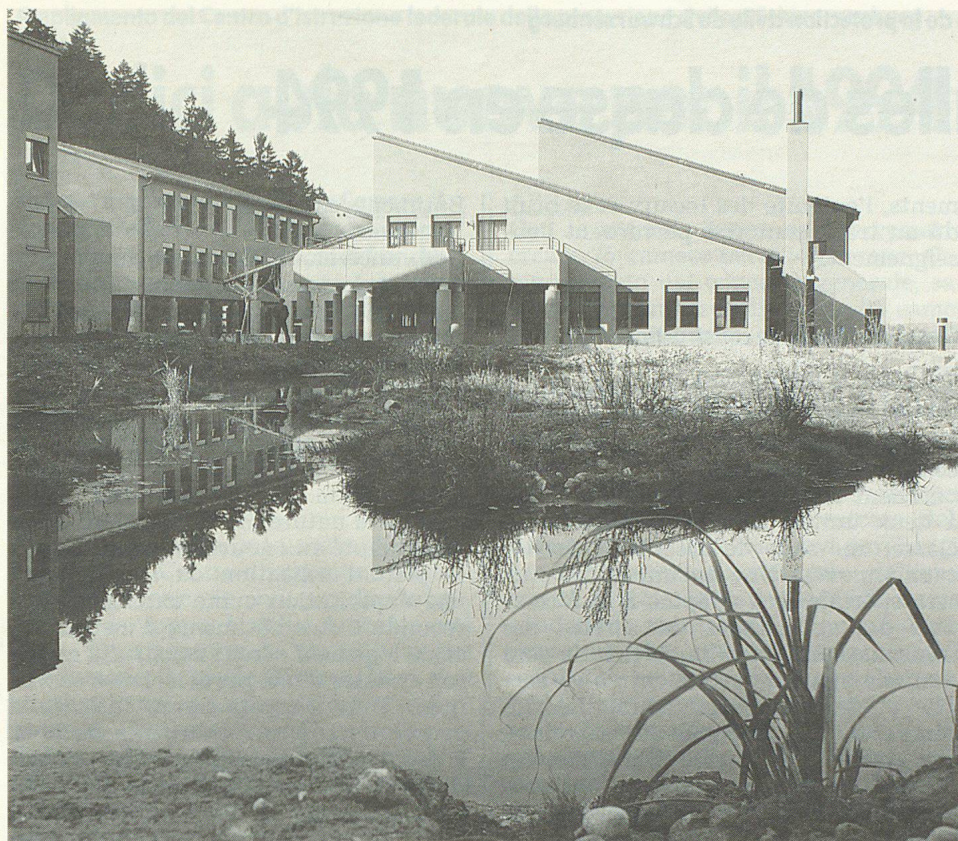
Das eidgenössische Zivilschutz-Ausbildungszentrum in Schwarzenburg.

den alle wesentlichen räumlichen und unterrichtsrelevanten Voraussetzungen für eine einheitliche und zielgerichtete Ausbildung vorhanden sein, um die Schulung der oberen Kader, die Ausbildung von Spezialisten technisch aufwendiger Dienste und die zentrale Schulung der Instruktoren des Bundes, der Kantone und der Gemeinden sicherzustellen. In Anbetracht der bisherigen und der zu erwartenden Mietkostenentwicklung und unter Berücksichtigung der nutzbaren eigenen Landesreserven ist es für den Bund längerfristig wesentlich wirtschaftlicher, die dem BZS anfallenden Instruktionendienste in eigenen Räumlichkeiten durchzuführen. Bundeseigene Ausbildungsanlagen garantieren – im Gegensatz zu Mietobjekten – die gewünschte Unterbringungs- und Durchführungssicherheit. Ferner werden durch die Zentralisierung Dislokationen mit Motorfahrzeugen während der Kursdauer auf ein Minimum beschränkt.