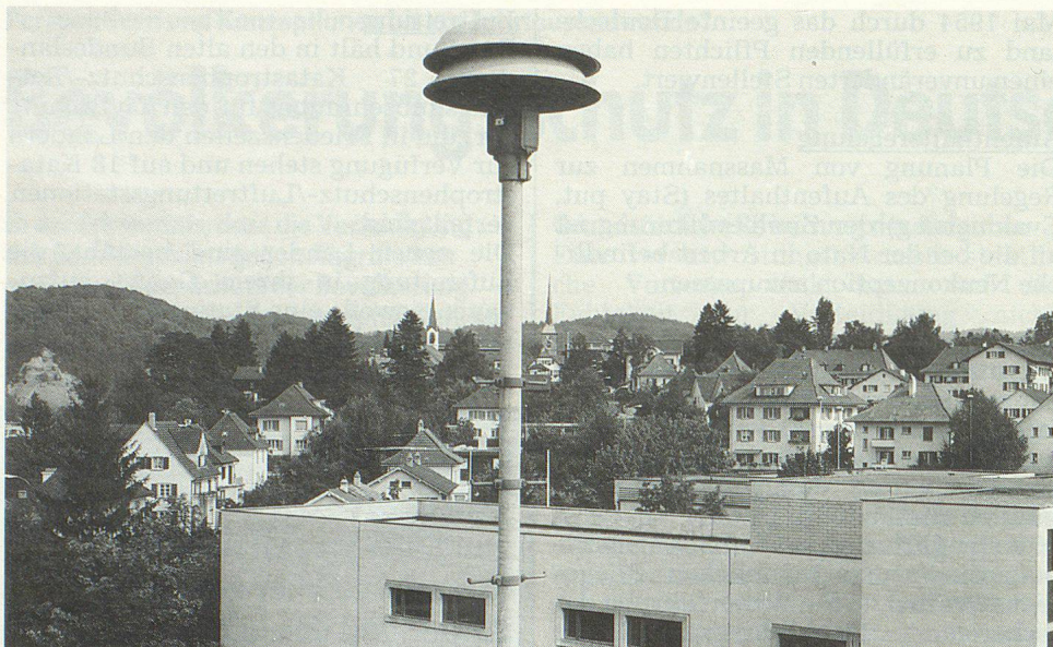
Das System der stationären Sirenen hat in Deutschland bald ausgedient. Es soll durch ein flächendeckendes Warn- und Alarmierungssystem ersetzt werden.