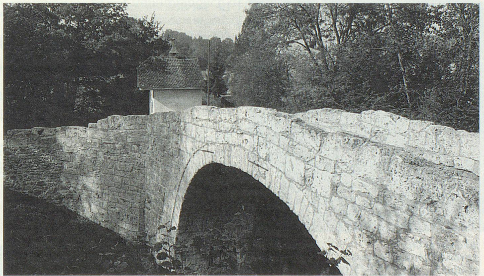
Le Pont gallo-romain et la Chapelle Ste-Apolline.

Plus loin, du côté de Charmey, soit à plus de trente kilomètres de Villars-sur-Glâne, une équipe de vingt pionniers participaient à la réfection d'un chemin piétonnier. Dans ce cas, c'est sur la demande du canton que plusieurs organismes de protection civile participaient à ce chantier de longue haleine. Il faut dire que le chemin en question conduit de Charmey au couvent de la Valsainte, à flanc de coteau et que ces dix kilomètres étaient en piteux état. Ce sont les communes de Bulle, Trey-