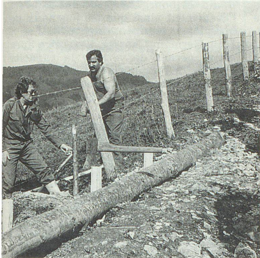
Etayage du chemin... attention les doigts semble dire l'ancien champion cycliste Auguste Girard (à gauche).