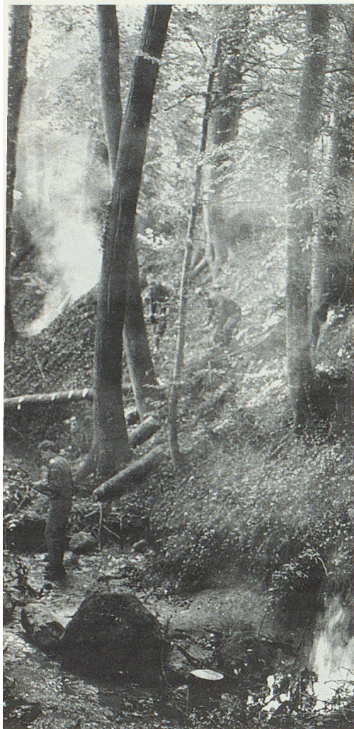
Ruisseau du Crozet: travail difficile dans la pente et la fumée.

demandent les personnes âgées, après avoir suivi une journée complète de cours dispensé par le personnel infirmier.