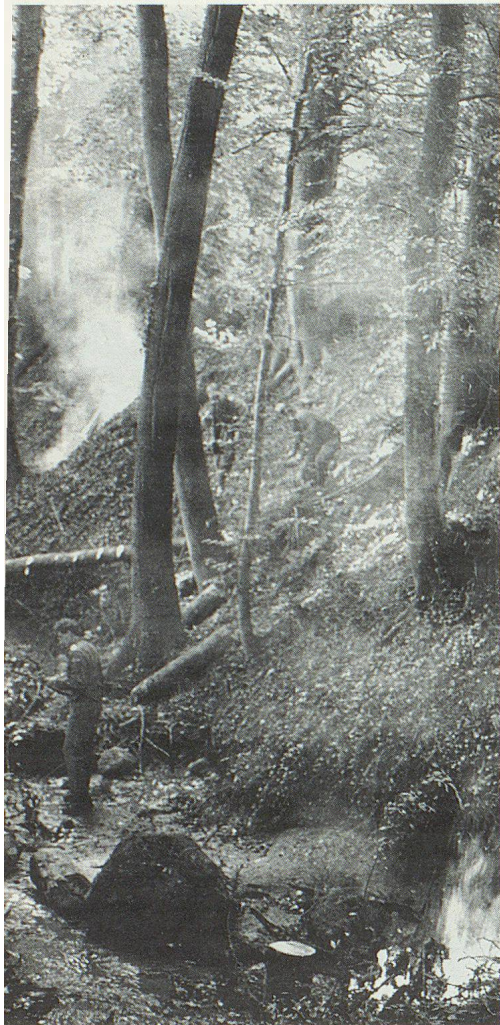
Ruisseau du Crozet: travail difficile dans la pente et la fumée.

demandent les personnes âgées, après avoir suivi une journée complète de cours dispensé par le personnel infirmier.