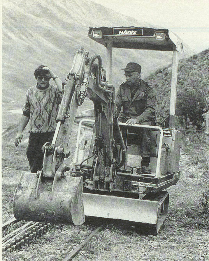
Der Bauchef der DFB liess auch leichte Baumaschinen einsetzen.