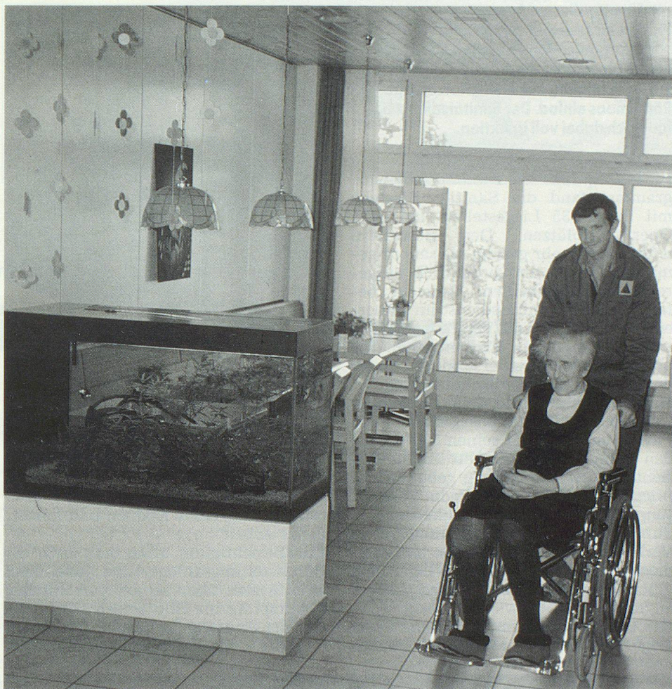
Der Einsatz der Zivilschützer brachte Abwechslung in den Alltag der Altersheimbewohner.

Ein spezielles Programm führte der Sanitätsdienst im Altersheim «Gosmergart» durch. Erstmals wurde nach theoretischer Vorbereitung eine zweitägige praktische Übung mit pflegebedürftigen Menschen realitätsnah durchgespielt. Unter Anleitung des Pflegepersonals wurden alltägliche Arbeiten in den Bereichen Körperpflege und Patientenbetreuung ausgeführt. Abwechslung in den Alltag der Heimbewohner brachte der Ausflug nach Isleten, einem beliebten Ausflugsort am Urnersee. Auch ein Besuch im Tell-