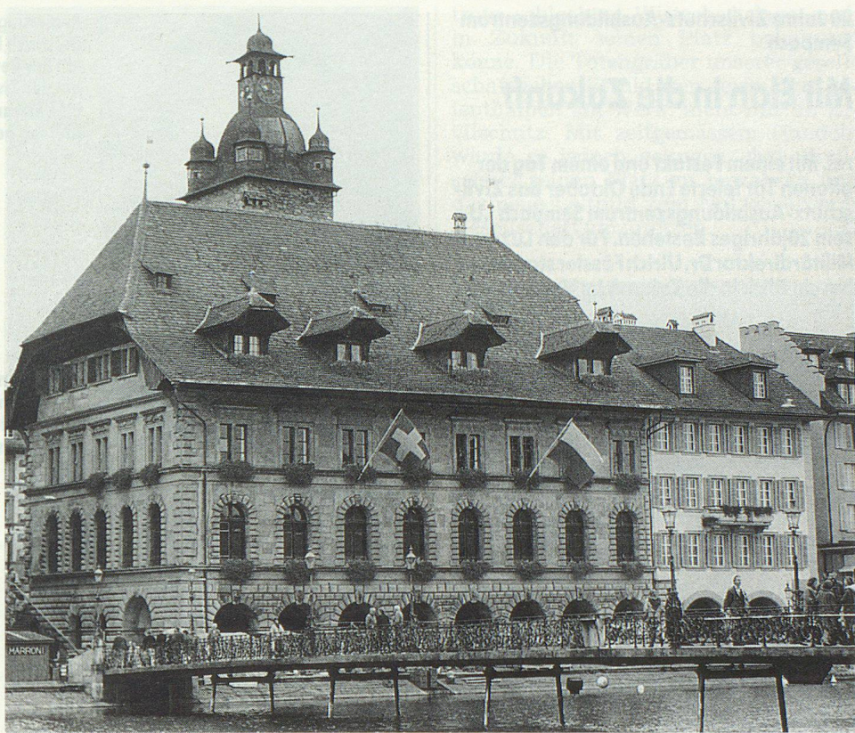
Luzerner Altstadtpanorama mit dem historischen Rathaus, das viele Kulturgüter enthält.