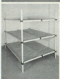
Dreier- und Sechserliegen

Kellergestell in Friedenszeiten. Bequeme Liegestelle im Katastrophenfall, dank integrierter Tuchliegefläche ist KEINE MATRATZE notwendig.