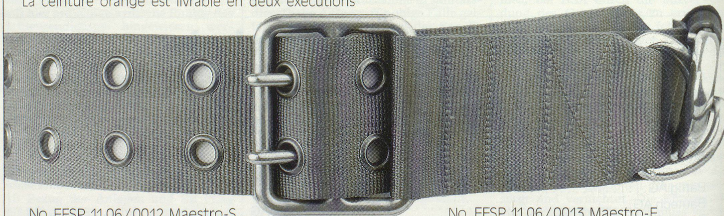
No. FFSP 11.06/0012 Maestro-S

et trois dimensions. Maestro-S avec 90°, boucle pour la hache et avec mousqueton pour les gants. Maestro-F avec anneau droit, boucle pour la hache et avec mousqueton pour les gants.