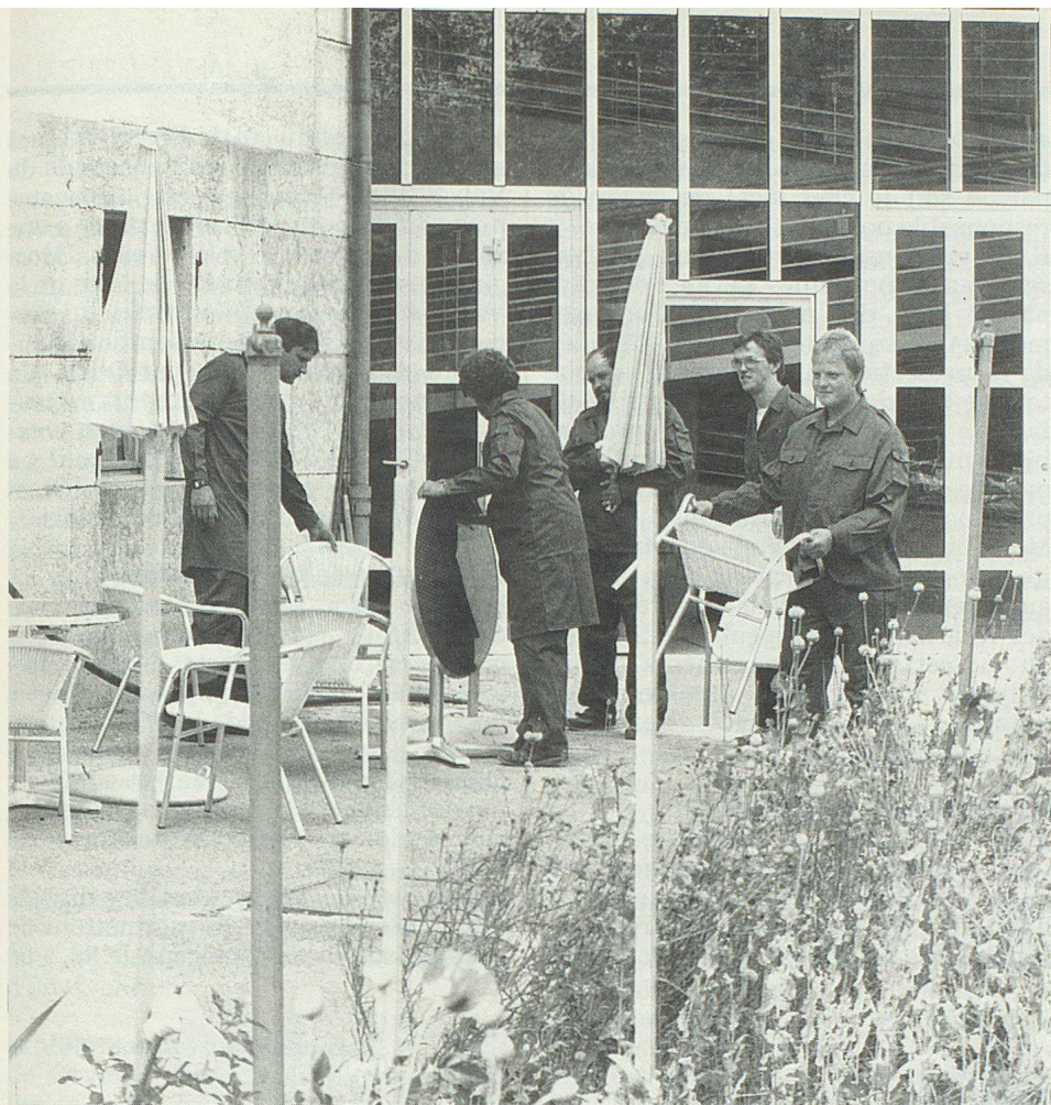
L'équipe PCI au grand complet aménage la terrasse.