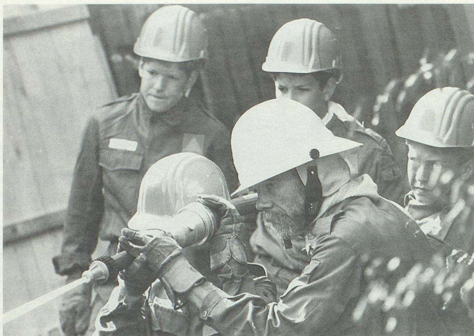
Instruktion am Strahlrohr.

schnell eingesehen. Doch wie staunten alle, als auch der kleinste Käsehoch ohne grossen Kraftaufwand mit dem gemeinsam gebauten Flaschenzug und unter Zuhilfenahme eines Seilzugapparates die Last verschieben konnte. Pioniergeräte, wie Kompressor und Tauchpumpe, fanden ebenso grosses Interesse wie auch das Binden von Knoten und Seilverbindungen für den Bau von Konstruktionen. Ein nicht alltägliches Erlebnis war bestimmt auch der Bau einer Holzbrücke über einen rund 20 Meter langen Geländeabschnitt, auf einer Höhe von 1 bis 3 Metern.