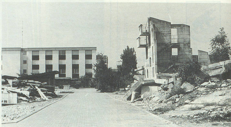
Blick vom Übungsgelände auf den Unterkunftstrakt.

Der 30. Oktober ist für die Ortsleitungen reserviert. Auf dem Programm stehen Besichtigungen und Einsatzübun-