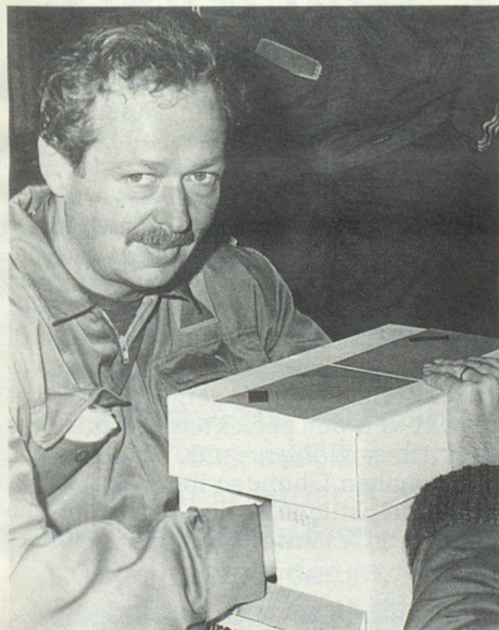
Prüfung der Sinne. Was wohl in dieser Schachtel enthalten sein mag?

Hier waren sanitätsdienstliche Kenntnisse gefragt.