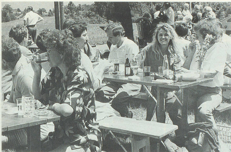
Stimmung, Durst und gute Laune...