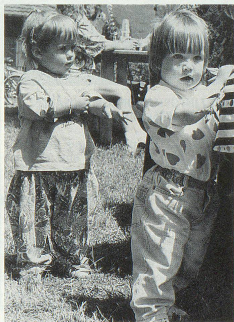
«Mami, wir möchten auch zum Zivilschutz.»