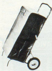
Paketroller mit Tasche

Auswahl aus unserem Lieferprogramm: Transportgeräte, Hebezeuge und Zubehör