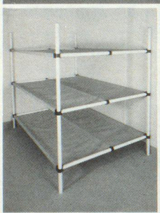
Dreier- und Sechserliegen

Das UBAG-Schutzraummobiliar besteht aus stabilen, pulverbeschichteten Stahlrohrrahmen, hochwertigen Dupont-Kunststoff-Steckprofilen und verrottungssicheren Tuchbespannungen. Schocktest und BZS-Zulassung M89-22 für sämtliche Zivilschutzräume.